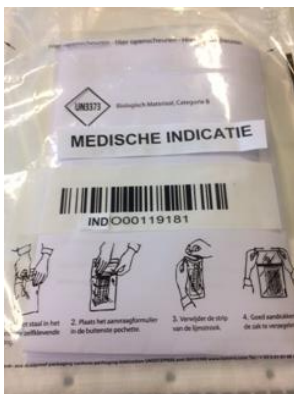
Safetybag voorzien van barcode t.b.v. medische Indicatie (indicatiecytologie/histologie)