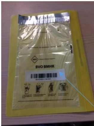
Safetybag voorzien met barcode t.b.v. BVO

Huisarts/assistente plaats het materiaal en aanvraagformulier op de hieronder aangegeven wijze in de daarvoor bestemde safetybag. LET OP!! Er is onderscheid tussen BVO en Histologie/.indicatie cytologie.